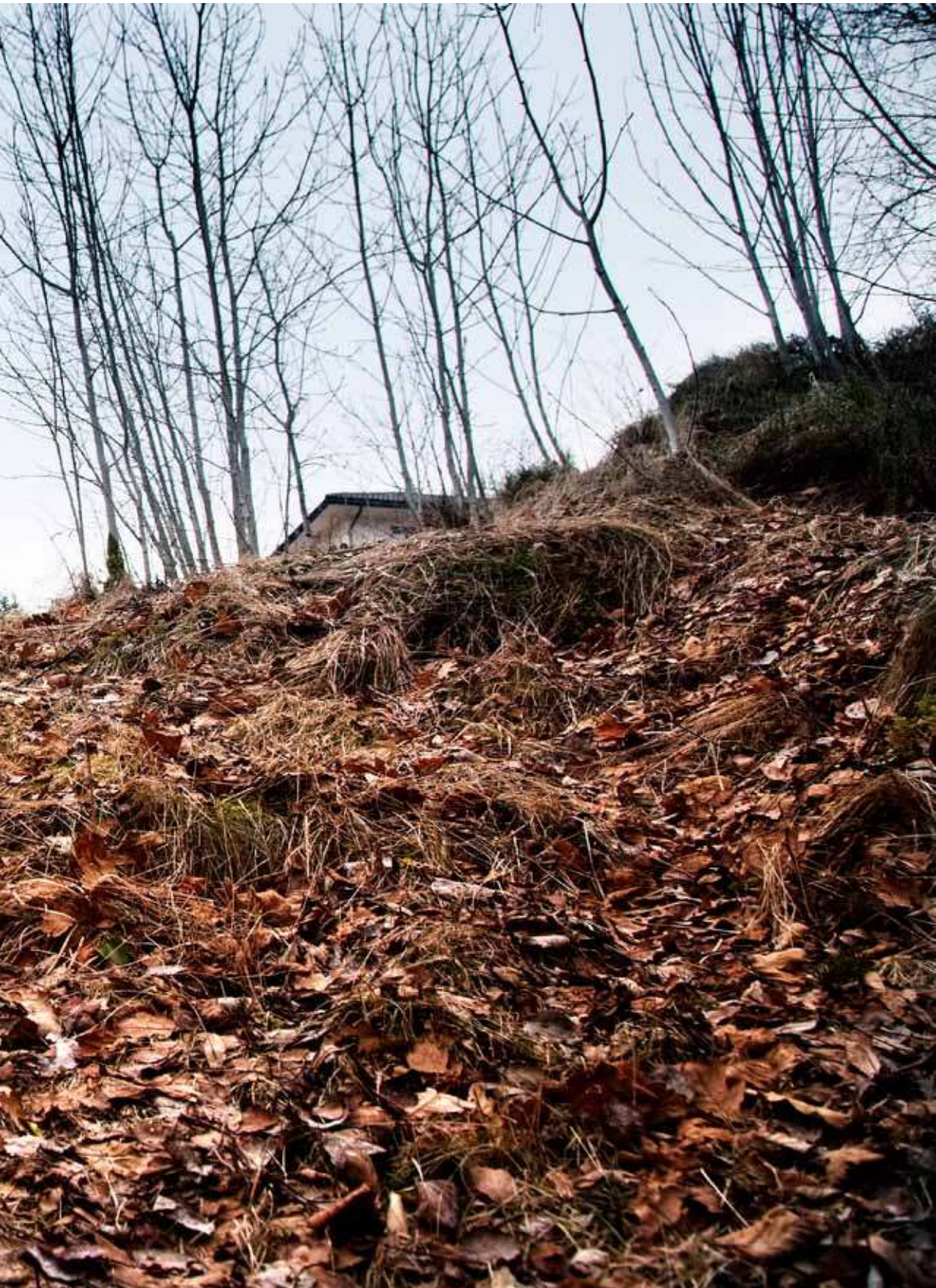
gjev mora eineomsorga for Anders.

petanseheving hjå dommarane i slike saker, og det trur eg domstoladministrasjonen er samd i, seier han.